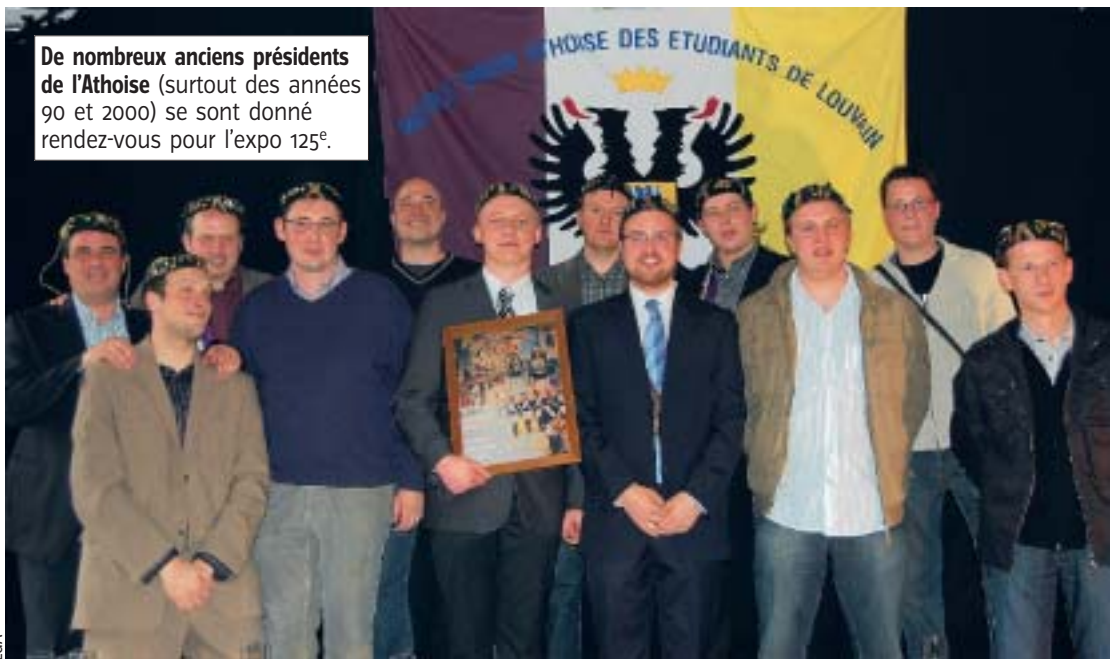
De nombreux anciens présidents de l'Athoise (surtout des années 90 et 2000) se sont donné rendez-vous pour l'expo 125 e .